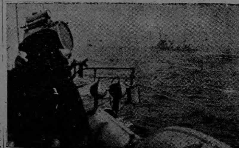
Dos torpederos de la marina francesa, marchan a toda velocidad hacia el lugar donde apareció un periscopio para lanzar granadas submarinas