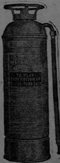
Extintor de Incendio

No lo piense un instante! Luego... Será tarde! Ponga ya un