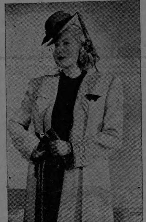
Abriego de lana amarilla con bordados. Vestido en crepé color ciruela. Sombrero en fieltro azul pastel con velo negro. Creación Rose Valois